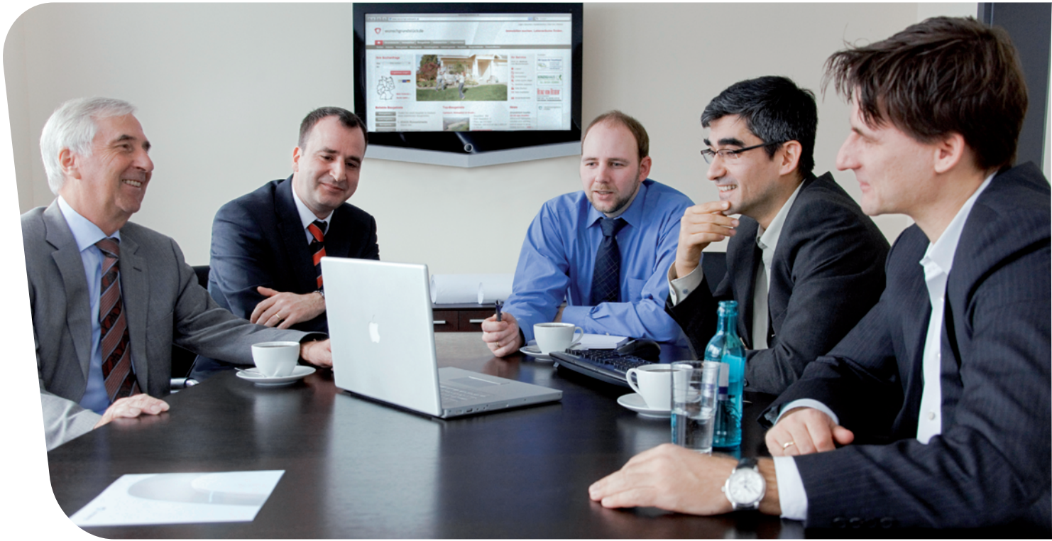
Planen, konzipieren, Ideen entwickeln: Die Geschäftsführer der Terragroup erarbeiten passgenaue Lösungen für ihre Kunden.