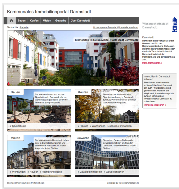
Das kommunale Immobilienportal der Stadt Darmstadt