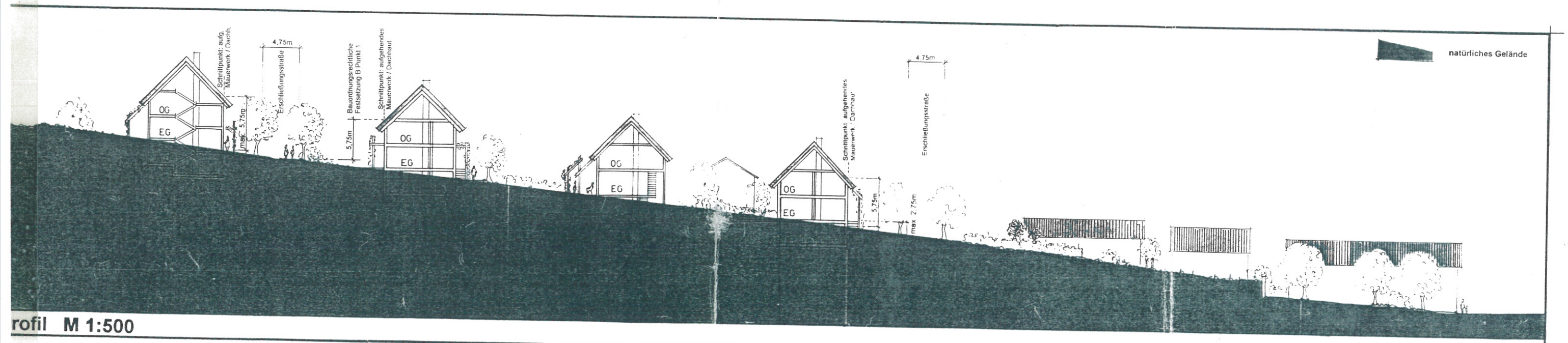
profil M 1:500