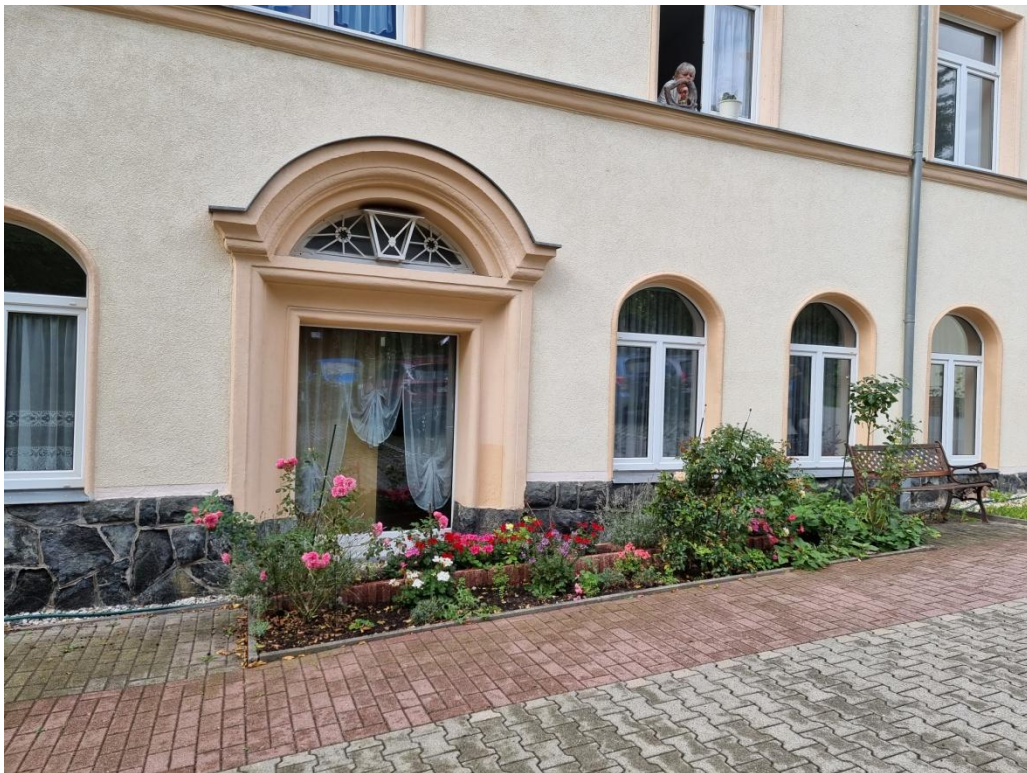
Blumige Grünstreifen am Gebäude entlang