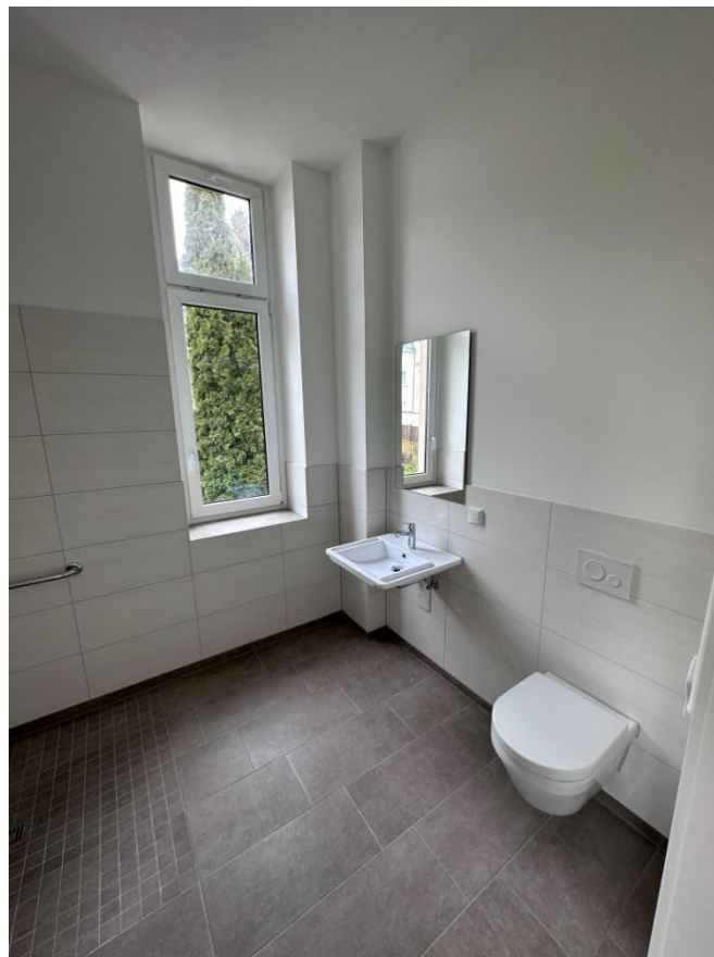
Beispielfoto: barrierearme rollstuhlgerechte Bäder