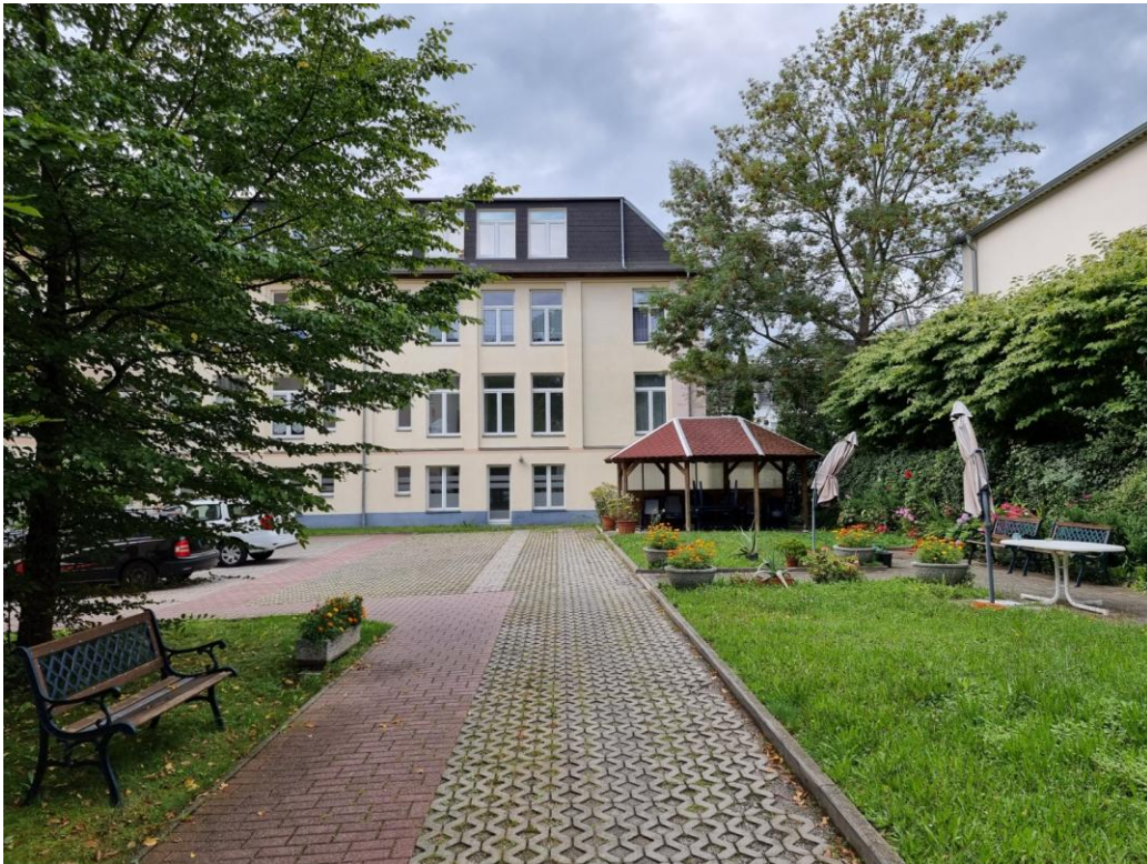
Grüne Außenanlage mit Sitzgelegenheit und Parkplatz

IMMOBILIEN-PROJEKTENTWICKLUNG & BERATUNG