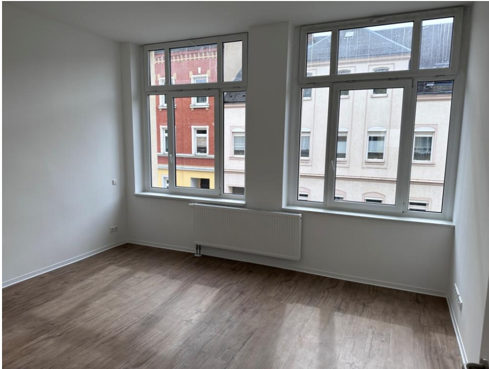
Beispielfoto: heller Wohnbereich

IMMOBILIEN-PROJEKTENTWICKLUNG & BERATUNG