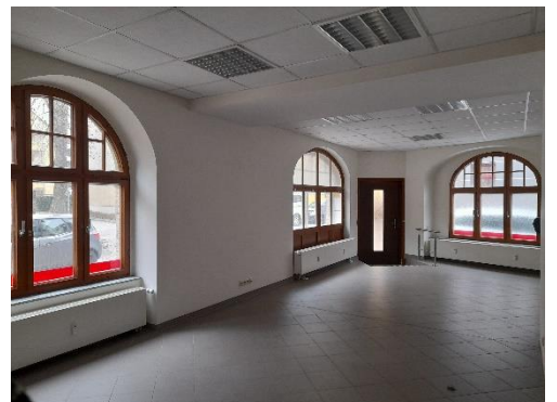
Gewerberaum 2.2 und Eingang