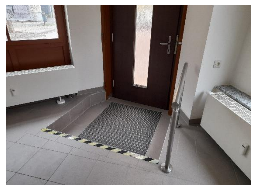
Stufe am Eingang