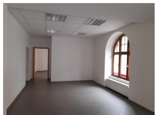
Tür zum Gewerberaum 2.1