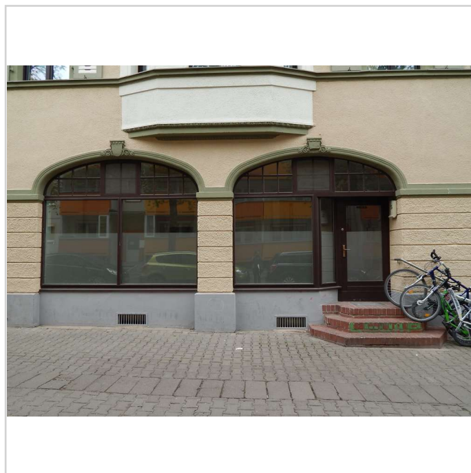
Schaufenster und Eingang

Der Kabelnetzbetreiber PYUR garantiert in der Stadt Gotha höchste Breitbandverfügbarkeit. Miete und Nebenkosten zzgl. MwSt.