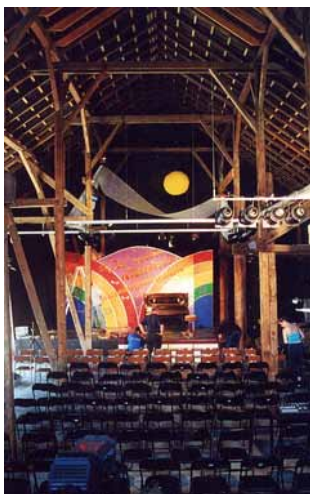
Galerie Bader: Kleinkunst- und Kulturscheune