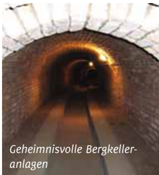
Geheimnisvolle Bergkeller- anlagen