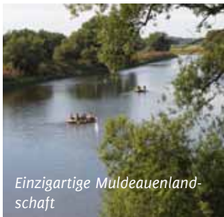
Einzigartige Muldeauenland- schaft