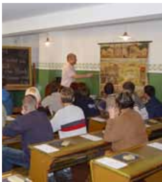
Stadtmuseum mit Klassenzim- mer der 1920er Jahre