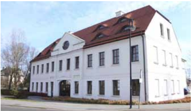
Firmensitz der EWV am Maxim-Gorki-Platz 1.