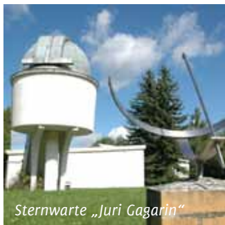
Sternwarte „Juri Gagarin“