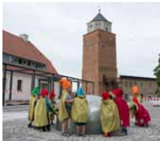
Sagemwobener Burgberg mit Lauschberg und Mauerturm