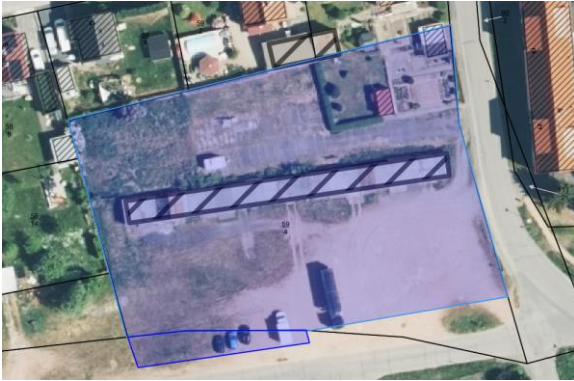
„Lageplan der zu veräußernden Fläche“

Über die Vergabe wird in öffentlicher Gemeinderatsitzung der Gemeinde Barchfeld-Immelborn entschieden.