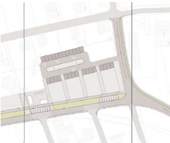
„Entwurfsbeispiel aus dem Quartierskonzept Oberer Bahndamm“