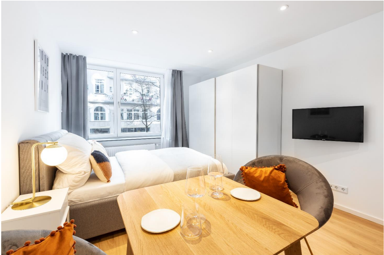
Möbliertes 1-Zimmer-Apartment nahe dem Königsplatz, Augustenstr. 43 in 80333 München