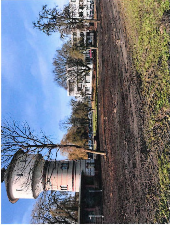
Bild 6. Fläche