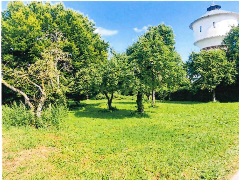
Bild 2: Grundstück neben dem Wasserturm (Obstwiese) – begrünt im Sommer