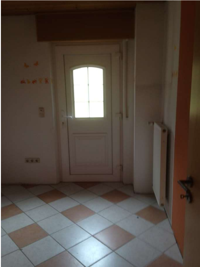
Flur mit Haustür