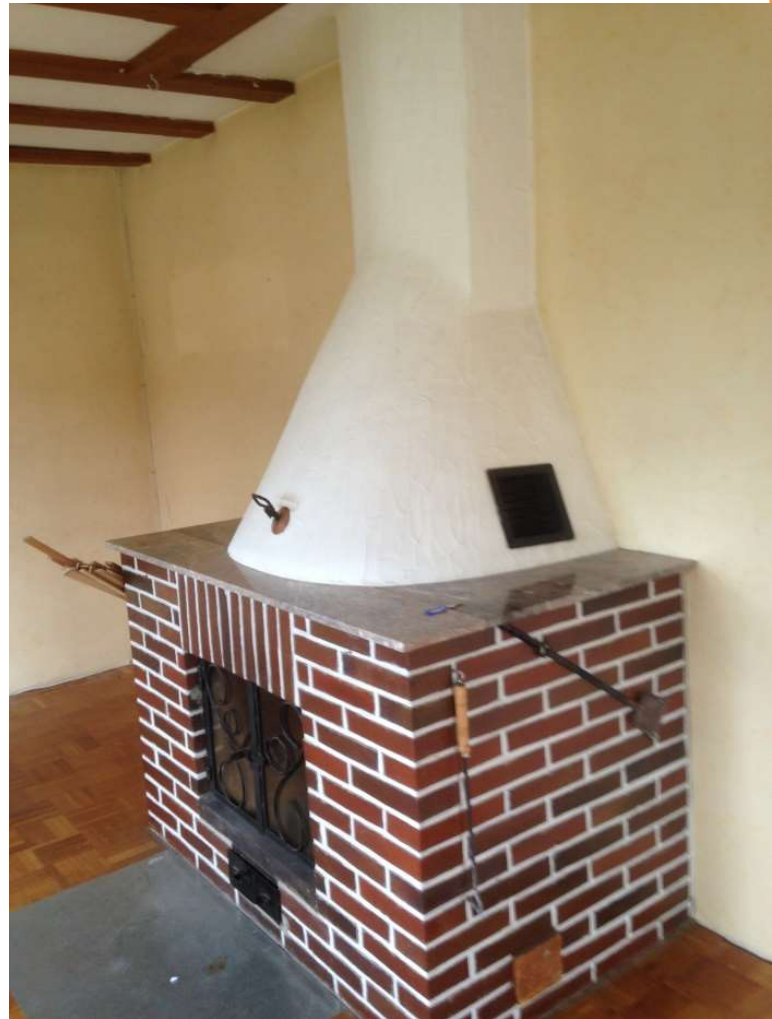
Mit offenen Kamin