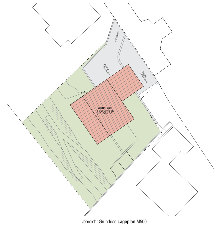
Übersicht Grundriss Lageplan M500