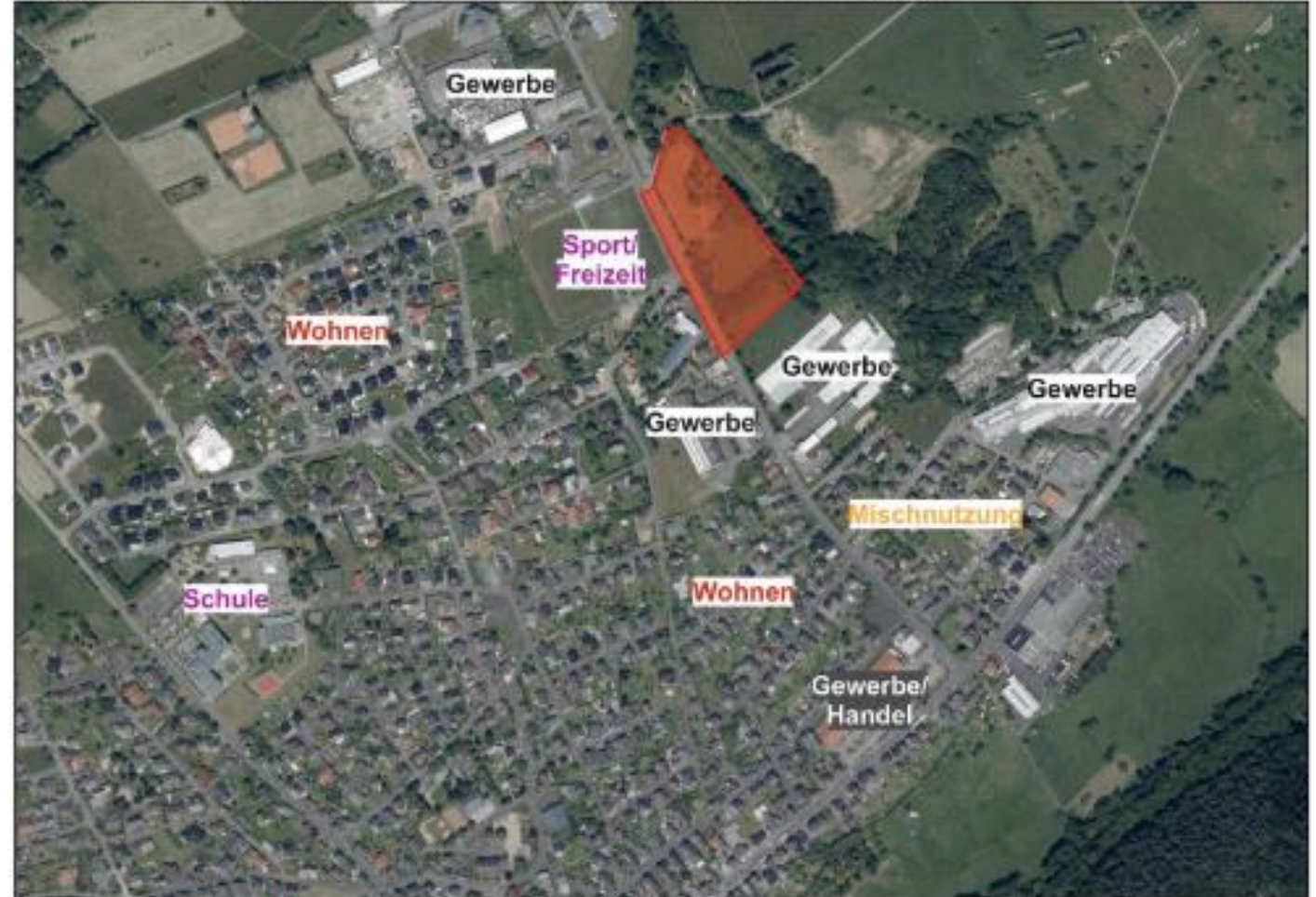
Abbildung 1: Lage des Plangebiets im räumlichen Zusammenhang

Das Plangebiet umfasst in der Flur 8 die Flurstücke 153/39 + 153/44 sowie Teilflächen von Flur 9 Flurstück 462/19 und Flur 10 Flurstück 471/41 (Straßenparzellen). Einbezogen wird das Straßengrundstück zur Anbindung des Gebiets an die bestehenden Gewerbeflächen.